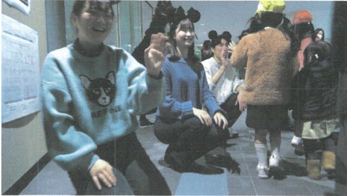
観劇会の終了後、園児とハイタッチする社会学部3年生ら

「人形観劇会」は同園が毎年、市の施設や園内の教室で行ってきたが、協定締結を機に、年少組から年長組までが一同に会して、観劇