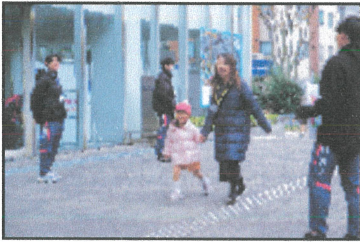
エンタランスで誘導作業を行う駅伝部の選手たち

また開演の冒頭、寺田園長の「みんなは今準備されたのは、学生が企画したアトラクション。園児が訪問したディズニースーランドに、近くクリスマス掛合わせた「お楽しみ」を披露した。ディズニークラクターのシルエツトクイズの後、ステージに学生が登場。頭にキャラクターのカチューシャをつけて、園児たちと「ジャンポリミッキー」のダンスを楽しむ